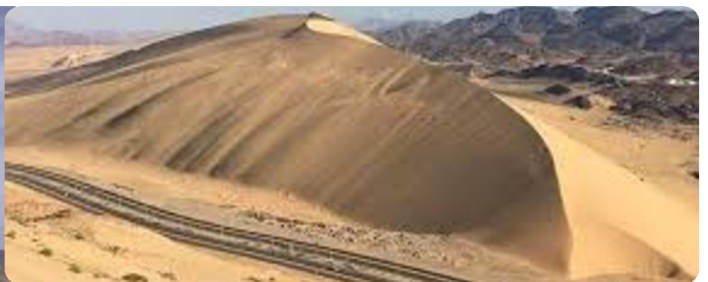
Badr & Jabal Malaikat

No. Siri kelulusan IU00575 dan tempoh sah laku iklan SAH SEHINGGA 30/09/2026.